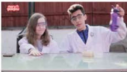
CLICK LAB: A Bacteria Experiment